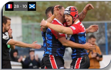
La joie des tricolores au coup de sifflet final

les esprits. Un huitième sacre pour les Bleus et cela faisait treize ans que les tricolores n'avaient pas ramené le Trophée international dans l'hexagone. Le trophée européen a été mis en place en 1935 par la fédération internationale. Depuis sa création l'équipe de France l'a remporté en 1939, 1949, 1951, 1952, 1977, 1981, 2005 et donc 2018.