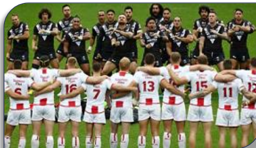
Les joueurs anglais pendant le Haka d'essais avant de sombrer en deuxième période. Les Kiwis qui vont ensuite accélérer le rythme laissant des anglais aux abois. Les

Grâce à un essai inscrit à la 74e alors que les deux équipes étaient à égalité (14-14), le XIII d'Angleterre est parvenu, sur la pelouse d'Anfield à Liverpool, à vaincre la Nouvelle-Zélande (20-14). Il remporte ainsi la série de test-matches (une première depuis 2007) après son succès initial (18-16) à Hull, huit jours plus tôt. La revanche maorie est intervenue sur le troisième test avec une vraie leçon de rugby à XIII donnée au public anglais sur leurs terres 34 à 00. L'équipe anglaise coachée par l'australien Wayne Bennett a fait jeu égal en première mi-temps et aura vendangé trois occasions