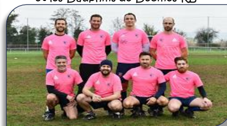
La formation des Blue Lyons de St Genis Laval