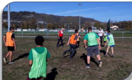
Les Minimes du Collège de Montréal-la Cluse