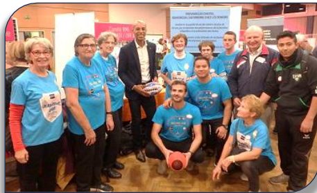
Stéphane Diagana au stand de Silver XIII avec les séniors

habitué à cette pratique. Le double Champion du monde d'athlétisme Stéphane Diagana a été particulièrement séduit par les