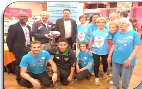
Visite du Maire de Villeurbanne sur le stand Silver XIII

atouts de ce programme et par son aspect ludique, visible sur le visage de tous les participants au programme.