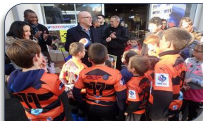
Remise d'un tableau au député par les jeunes tigres de CTRR