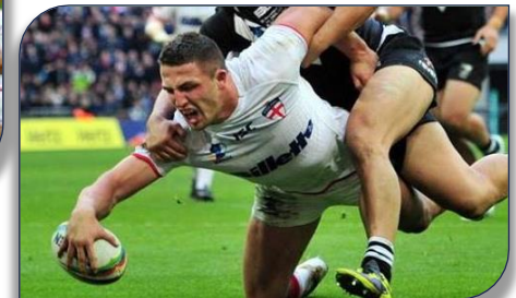
Essai anglais à la 74e minute

joueurs maoris, ont ainsi relevé la tête de belle manière et pourront rentrer au pays, l'honneur sauf...après les deux premiers échecs. !