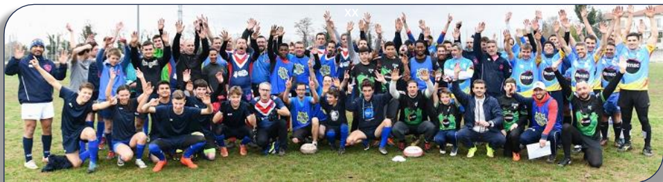
Photo souvenir des 80 participants au Challenge Bernard Vizier à Décines le 17 Novembre