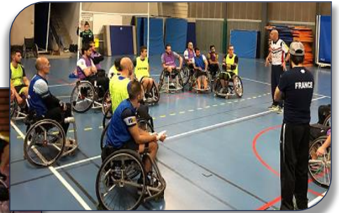
les stagiaires à Barcarès le 25 Novembre