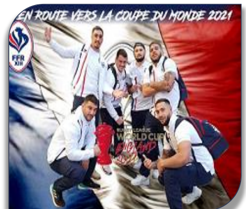
En route vers la Coupe du Monde !!!