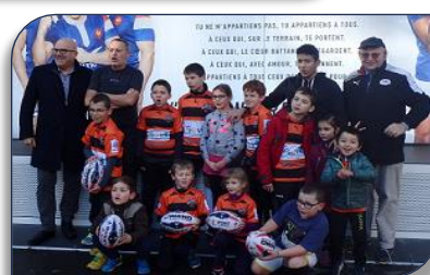
la formation des Tigres avec le député B. Bonnell

territoire de Villeurbanne, au travers de : partage de compétences, mise à disposition de moyens, mécénat d'entreprise financier ou de compétences. Ainsi, des Ballons Ronds pour le foot-ball et le basket mais aussi des ballons Ovale pour le club des Treizistes de Charpenne-Tonkin, des chasubles, chrono et sifflets ont été remis à une dizaine d'associations villeurbannaises. Les jeunes Treizistes de Charpenne Tonkin ont remis un tableau au député Bruno Bonnell qui a été très touché par ce geste.