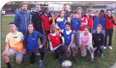
Les Minimes garçons et filles du collège Aimé Césaire

Montréal-la Cluse et au collège Lumière de Oyonnax.