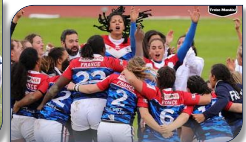
La joie des tricolores à la fin de la rencontre