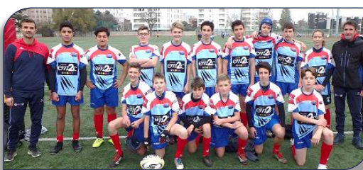
La Formation des Lions de Lyon Métropole XIII face aux mérinos de St Martin

Les jeunes Lions du Comité du Rhône et Métropole de Lyon de Rugby à XIII en provenance des clubs de Caluire – Sainte Foy Rugby League , VVRL et LVR XIII recevaient les Merinos de Saint Martin de Crau et dès le coup d'envoi les Provençaux ont imprimé un rythme rapide avec trois essais inscrits en moins d'un quart d'heure. Les Lions se reprenaient et manquaient de peu d'aller en dame, mais sur un ballon relâché le talonneur adverse contre attaquait et filait entre les poteaux (26 à 00 à la pause) . A la reprise les