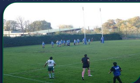
Transformation de l'essai par Iliass Laachiri face à Lescure

Le ballon s'élève haut dans le ciel villeurbannais, l'angle est parfait, la transformation fait basculer le tableau de