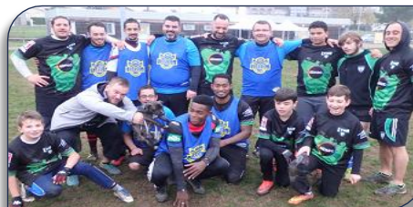
Les Lions de LVR.XIII et les Dauphins de Décines RL

d'avant match. Prochain RDV en Janvier à Roanne.