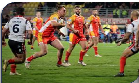
Une attaque des Dragons face aux tricolores