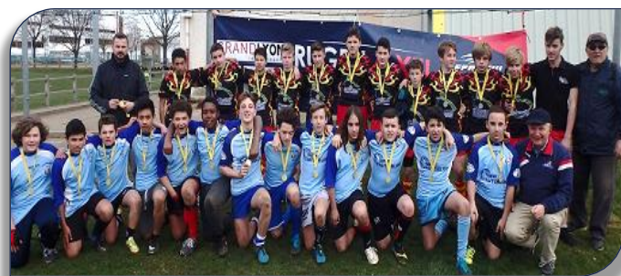
Les Minimes des collèges Maryse Bastié et de Décines (en bleu) et de Champagnat de Feurs en 2018

Le 6 Mars prochain aura lieu la phase qualificative pour les championnats de France catégorie minimes garçons et filles au stade Boiron Granger de Villeurbanne. Les rencontres concerneront quatre collèges du Rhône: collèges de Maryse Bastié et Brassens de Décines, Champagnat de Feurs et le collège de Montréal La cluse. D'autre part il devrait y avoir aussi une rencontre inter académique Minimes filles entre le collège Jean Vilar de Chalon et le collège Champagnat de Feurs.