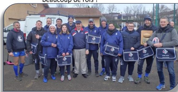
Les éducateurs avec la malette et le livret de compétences