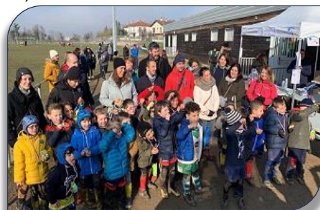
Le sourire des jeunes U7 avec la médaille