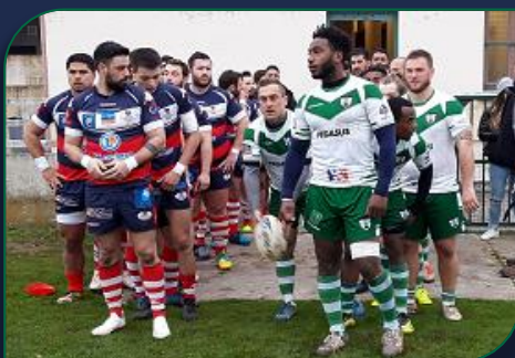
Entrée des joueurs pour la réception de Villefranche de Rouergue