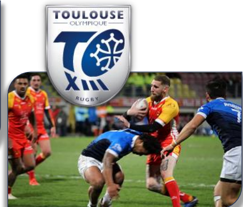
L'attaque des Olympiens face aux Dragons Catalans