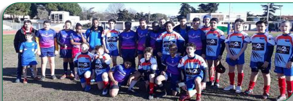
La formation des Lions U15 de Lyon Métropole 13 et de Marseille 13 à la fin du match

Après la trêve des confiseurs, les jeunes minimes (U15) de Lyon Métropole XIII ont effectué deux déplacements à St Martin de Crau et Marseille. Si la défaite dans la plaine de La Crau avait laissé entrevoir de nouvelles ambitions, elles se sont concrétisées lors du déplacement à Marseille fin Janvier et un premier succès mérité qui a ramené le sourire chez les joueurs. Un succès 20 à 14 avec quatre essais côté Lyonnais. Ils ont maîtrisé les débats de bout en bout avec un score de 10 à 4 à la pause. Place maintenant à la deuxième phase avant des vacances bien méritées.