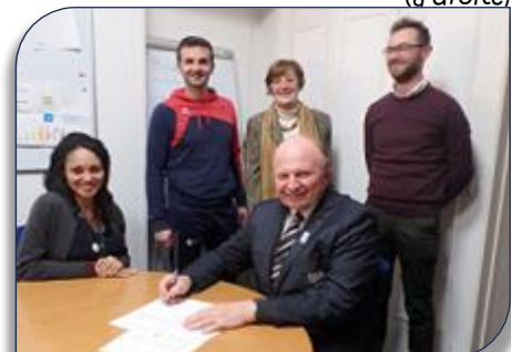
Signature de la Convention de partenariat