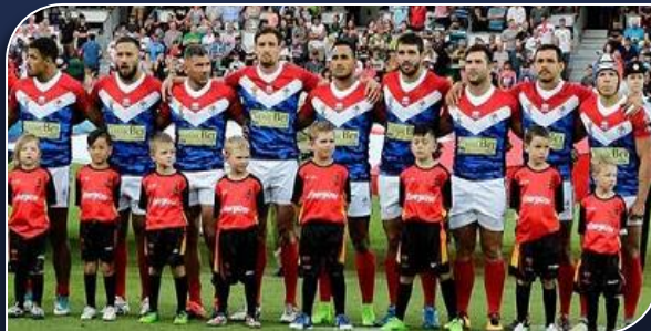
Les Coqs tricolores lors de la dernière Coupe du Monde