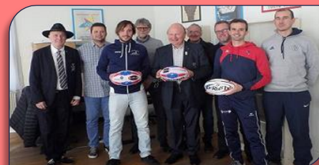
Les participants à la réunion de validation du livret pédagogique

siège du CDOS du Rhône et Métropole de Lyon le vendredi 25 Janvier pour valider le livret pédagogique « Rugby à l'Ecole » qui permettra l'enseignement du Rugby (XIII ou XV ou VII) à l'école plus facilement et en toute sécurité dans les écoles élémentaires du Rhône et Métropole de Lyon. Une dernière ligne droite avant la validation du document en Mars prochain.