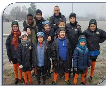
Les jeunes tigres de CTTRL