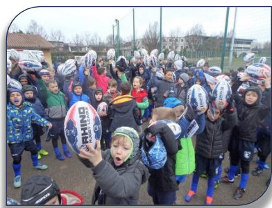
Une pluie de ballons pour les jeunes Lions de l'EDR de SFRL

recevra en plus du ballon un livret d'accueil où il retrouvera les règles du jeu, et chaque éducateur diplômé et licencié en club recevra une sacoche avec le livret de compétences . Tous les éducateurs et dirigeants ont applaudi cette initiative Présidentielle de donner des outils et un ballon à chaque enfant car c'est le meilleur moyen de faire connaître la discipline et de donner du plaisir à tous ces enfants ! Tous les participants se sont ensuite retrouvés pour partager la galette et il y eut beaucoup de rois !