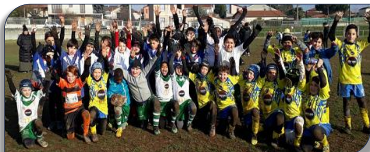
La joie des U11 à la fin de l'entraînement