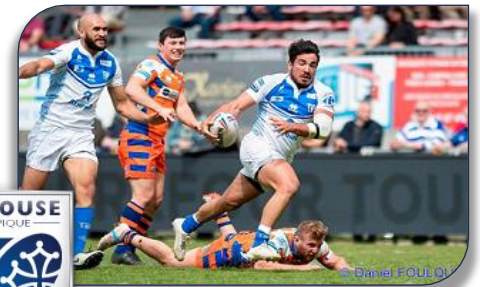
une contre attaque des Toulousains face à Halifax