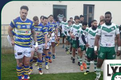
Entrée des deux équipes de Ferrals et LVR au stade Lyvet