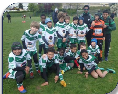
Les U11 de LVR/VVRL/CTTRL sur le podium