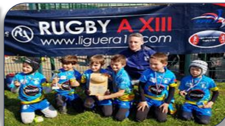
La joie des U11 de SFRL avec le boucier