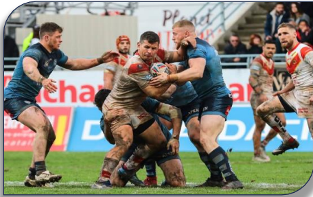
L'attaque des Dragons Catalans stoppée par les Saints

le score de 18 à 10. Huit jours plus tard les joueurs du Président Guash ont laissé échapper la victoire au point en or face à Hull FC 31 à 30 avant de se reprendre à Londres (39 à 6) et ensuite le lundi de Pâques à Brutus face aux Tigres de Castleford 37 à 16 après avoir maîtrisé la rencontre de bout en bout.