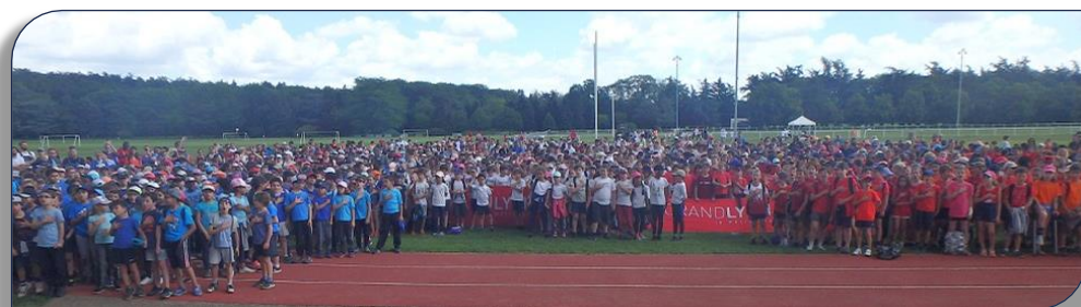
Les participants de la 14eme édition du challenge Petit treize au Parc de Parilly le 1er Juin dernier