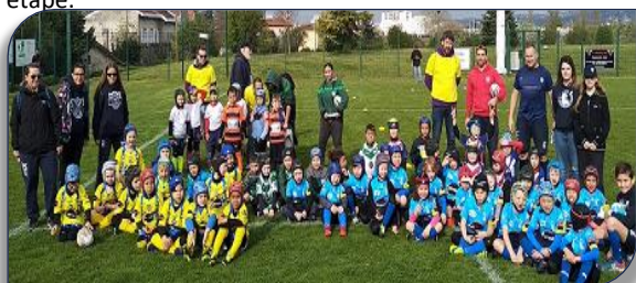
Les Jeunes U7 avant la remise des médailles