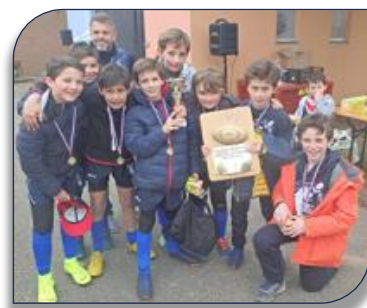
La joie des U11 de SFRL avec le boucier