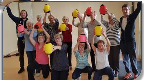
La joie des seniors du groupe 2 de Vourles