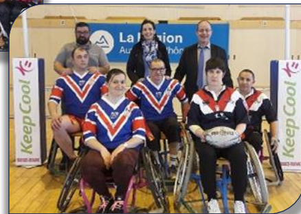
Les Champions de La Loire avec les personnalités