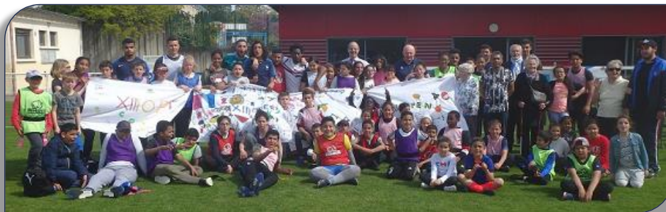
Photo souvenir avec les participants en face des trois drapeaux des centres sociaux et de séniors de Jean Jaurès

La cinquième édition du Challenge Treiz' Open organisée par le comité du Rhône et Métropole de Lyon de rugby à XIII, la Ligue AURA et l'assistance des clubs de LVR XIII, VVRL et DRL a eu lieu du 15 au 18 Avril avec un temps fort le Jeudi 18 Avril au stade Lyvet de Villeurbanne sous un beau soleil printanier. Il a rassemblé plus de 50 jeunes garçons et Filles en provenance des centres sociaux partenaires. Ce tournoi marquait la fin du cycle d'initiation à la pratique du rugby à XIII, proposé pendant les vacances de Pâques dans les centres sociaux des villes de Vaulx en Velin (Peyri, jeunes de Chénier), de Villeurbanne (CS Ferrandière), et de Décines (CPNG).