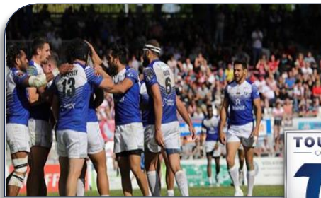
La joie des Toulousains à la fin du match devant leur public