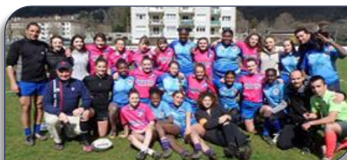
Les deux équipes de Cadettes avec leur coach et le Président de la Ligue

La rencontre entre les Cadettes du Lycée Bichat de Nantua et leurs hôtes du lycée Romain Roland de Goussainville aura été très disputée. Dès le coup d'envoi les visiteuses se portent à l'attaque et vont inscrire coup sur coup trois essais réussissant une bonne entame avant de voir les locales aller en dame. A la pause les visiteuses mènent 8