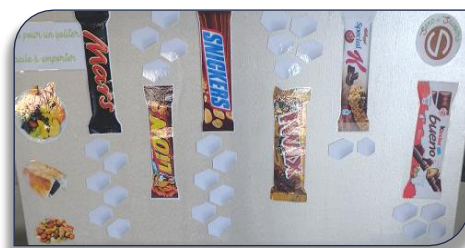
Alimentation : les équivalents en sucre de chaque goûter