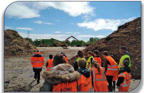
Visite sur le site de 20 ha de recyclage des déchets verts

Malheureusement, la pluie et le vent violent du mercredi ont eu raison de la course d'orientation, de la séance de ramassage de déchets et de la séance de sensibilisation à l'environnement qui avaient été programmées sur Miribel... ce sera pour un prochain stage !