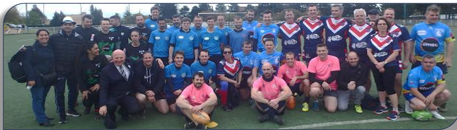
Les participants du Challenge Bernard Vizier lors de l'étape de Caluire et à gauche le Président de la ligue

Après les dix matches entre équipes plus un grand match de 20 minutes de rugby à XIII, il y a eu la remise des deux trophées soumis au vote des équipes à bulletins secrets. La Coupe du Fair-play est revenue aux Lions de SFRL et la Coupe du Beau Jeu aux Dauphins de DRL. Bravo à tous.