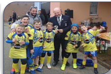
Les U9 de Décines RL glissent sur le podium