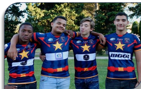
les 4 gônes lors de la tournée en Angleterre avec les U17 ligue Paca