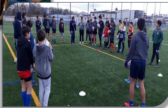
atelier sur le terrain sur le tenu et le placement