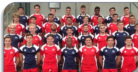
La promotion 2019 – 2020 des jeunes du Pôle Espoir de Salon

Quel est le programme d'un jeune dans cette structure ? Le principal objectif est d'allier études et sport de haut niveau. Tous les jeunes ont cours dans l'un de nos établissements partenaires, au lycée Adam-de-Craponne, au lycée des Alpilles à Miramas ou au collège Jean-Bernard. Ils ont un emploi du temps aménagé pour finir à 16 h et vont sur le terrain ensuite. Comme ils n'ont pas cours le mercredi l'après-midi, ils ont une grande séance d'entraînement de 13 h à 17 h. Le Pôle espoir de Salon de Provence fournit un vrai accompagnement de A à Z.