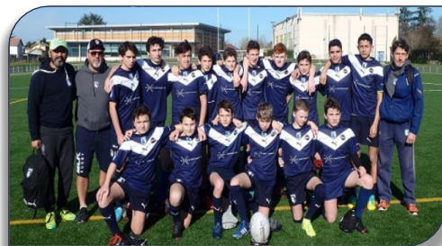
Les lions de SFRL avec les coach à St Martin de Crau