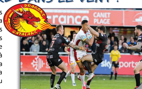
Une charge d'Israel Folau face à Salford

parfois victimes de trous d'air mais opiniâtres à souhait, et plus loin encore de la déculottée essuyée l'an dernier face à ces mêmes anglais ! La rencontre du 14 Mars entre les Dragons Catalans et les rhinos de Leeds qui devait avoir lieu au stade Brutus à huis clos a été annulée. Dès le 16 Mars, la Superleague annonçait l'annulation de la compétition à cause de la pandémie du Coronavirus 19.