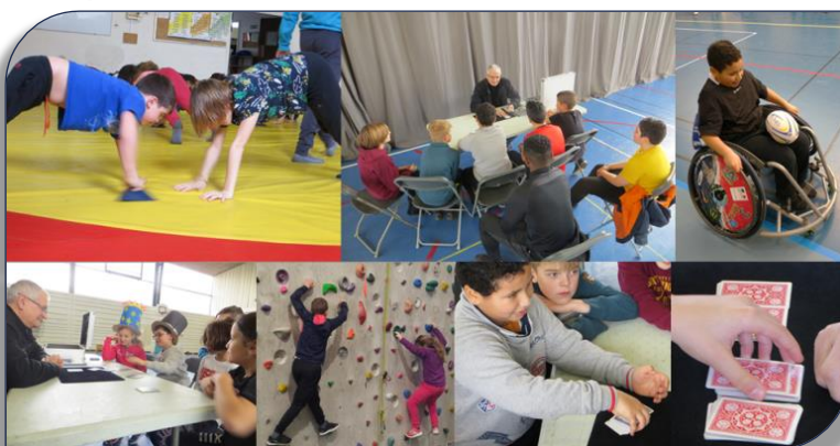
Des stagiaires multi-Cartes !

Côté Sports, c'est toujours l'occasion de s'ouvrir à d'autres associations décanoises et d'échanger sur d'autres sports.. Cette fois, le basket, l'escalade, l'athlétisme et la lutte étaient au rendez-vous... Quant au rugby à 13, il était présent dans sa version « Fauteuil » !