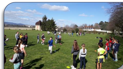
Atelier rugby à l'école des Trinitaires de Lyon

début Mars les ateliers de maniement du ballon ovale ont repris à l'école de la Nativité de Villeurbanne et aussi à l'école des Trinitaires de Lyon Croix Rousse. Cependant à partir du 16 Mars ils ont dû être interrompus suite à la fermeture des écoles. Le tournoi final du Challenge Petit Treize a été fixé au vendredi 12 Juin. Il n'est pas certain que la seizième édition du Challenge Petit Treize puisse avoir lieu sous sa forme habituelle. Une information plus détaillée sera diffusée dès la fin de la période de confinement.