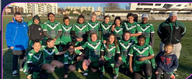
La formation des Lionnes de VVRL après leurs succès face à Bordeaux

Il est composé d'exercices de renforcement musculaire, mais aussi cardio-vasculaire et proprioceptif, pour faciliter le retour sur le terrain une fois le confinement levé. Elles ont toutes mis en application les exercices reçus. Cela va leur permettre de rester en forme pour faciliter la reprise une fois la fin du confinement.