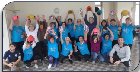
Le groupe de Gerland qui évolue à la salle des Pavillons le Lundi