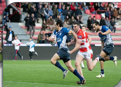
une belle attaque des Toulousains