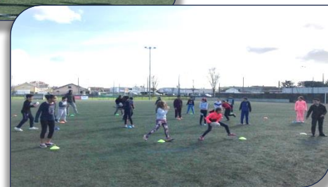
atelier passes avec les CM1/CM2