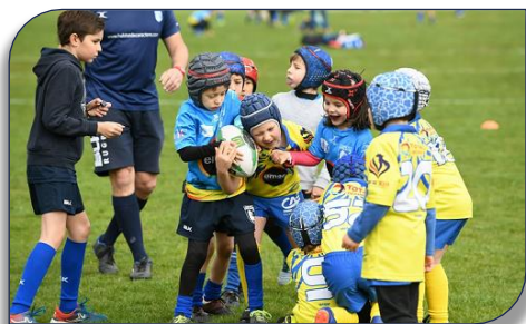
une rencontre des lions fidésiens face aux dauphins de DRL

À travers ce dispositif, les clubs pourront bénéficier d'une communication renforcée en direction de la jeunesse, mais également de leur famille ainsi que du corps enseignant sur leur offre sportive. Participer à cette opération, c'est permettre au club d'accueillir de nouveaux licenciés dans un cadre réglementé et favorisant l'apprentissage d'un sport et des valeurs qu'il transmet. Avec quelle couverture d'assurance ? la prise en charge par le CNOSF du volet assurantiel du dispositif sera réalisée par la souscription d'un contrat d'assurances groupe individuelle accident pour tous les enfants de CM1 et CM2 licenciés à l'UGSEL ou l'USEP. Le déploiement de ce dispositif sur notre territoire régional ne peut se réaliser sans la mobilisation des clubs. Ainsi, vous trouverez toutes les infos pour ceux qui souhaitent s'inscrire à ce dispositif en complétant le formulaire suivant formulaire carte passerelle . Une fois l'inscription effectuée, le club sera mentionné comme participant à l'opération « carte passerelle » dans l'application « Mon club près de chez moi ». Vous retrouverez plus d'information sur le dispositif sur le site internet du CROS AURA .