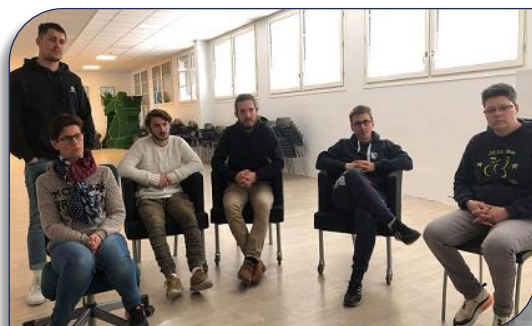
les stagiaires de la formation Educateur fédéral

La séance s'est terminée par un retour collectif vidéo et oral sur chaque présentation. La dernière séance consacrée aux gestes de premiers secours par le Docteur Xavier Fabre a été reportée à début Septembre pour cause de pandémie Covid19.