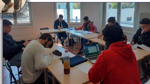
Séance de travail en salle pour les six stagiaires